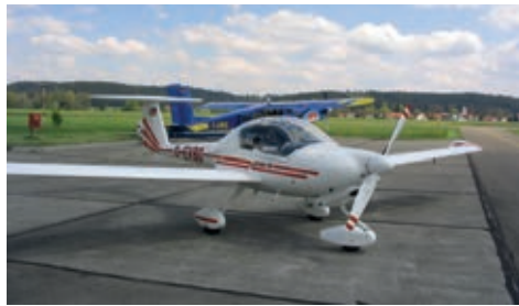
gesponsert durch LINKDESIGN, Schramberg - 6/2016, 1000